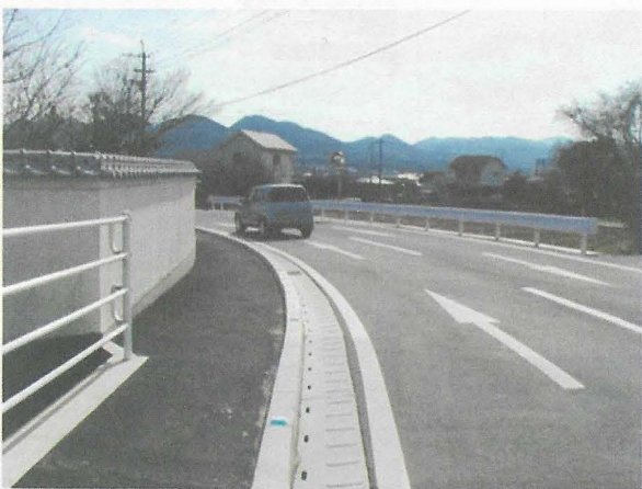
福岡県 (暗渠型側溝)