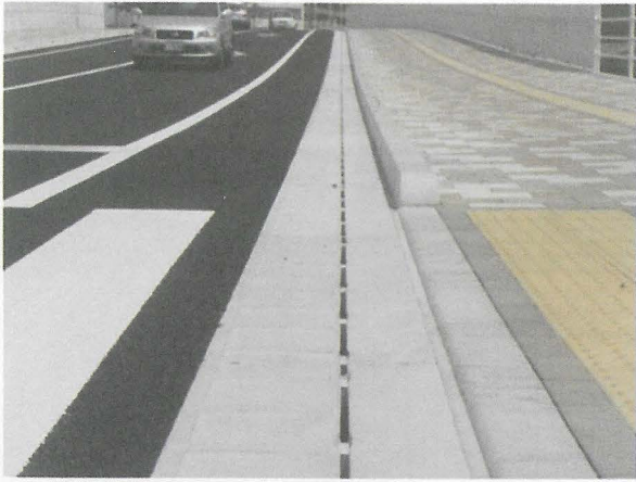
広島県 (勾配可変側溝)