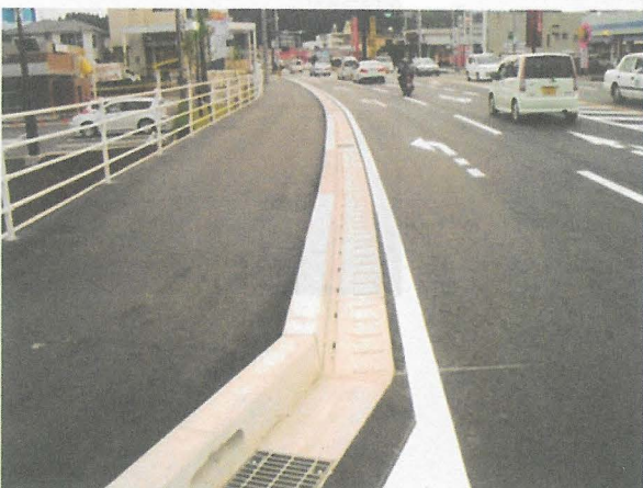
宮崎県 (暗渠型側溝)