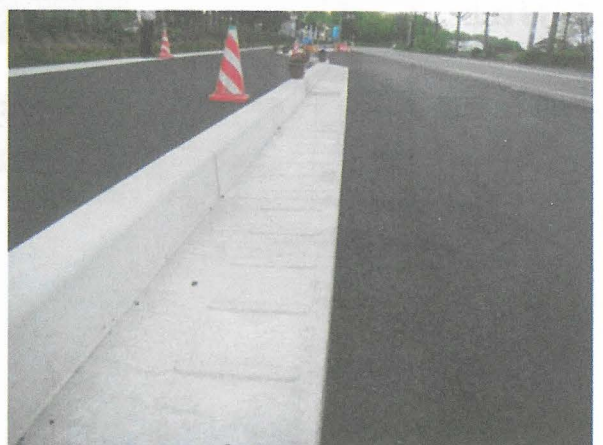
山形県 (鉄筋L形 : 2m)