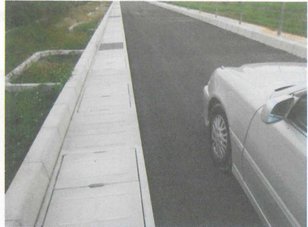
沖縄県 (勾配可変側溝)